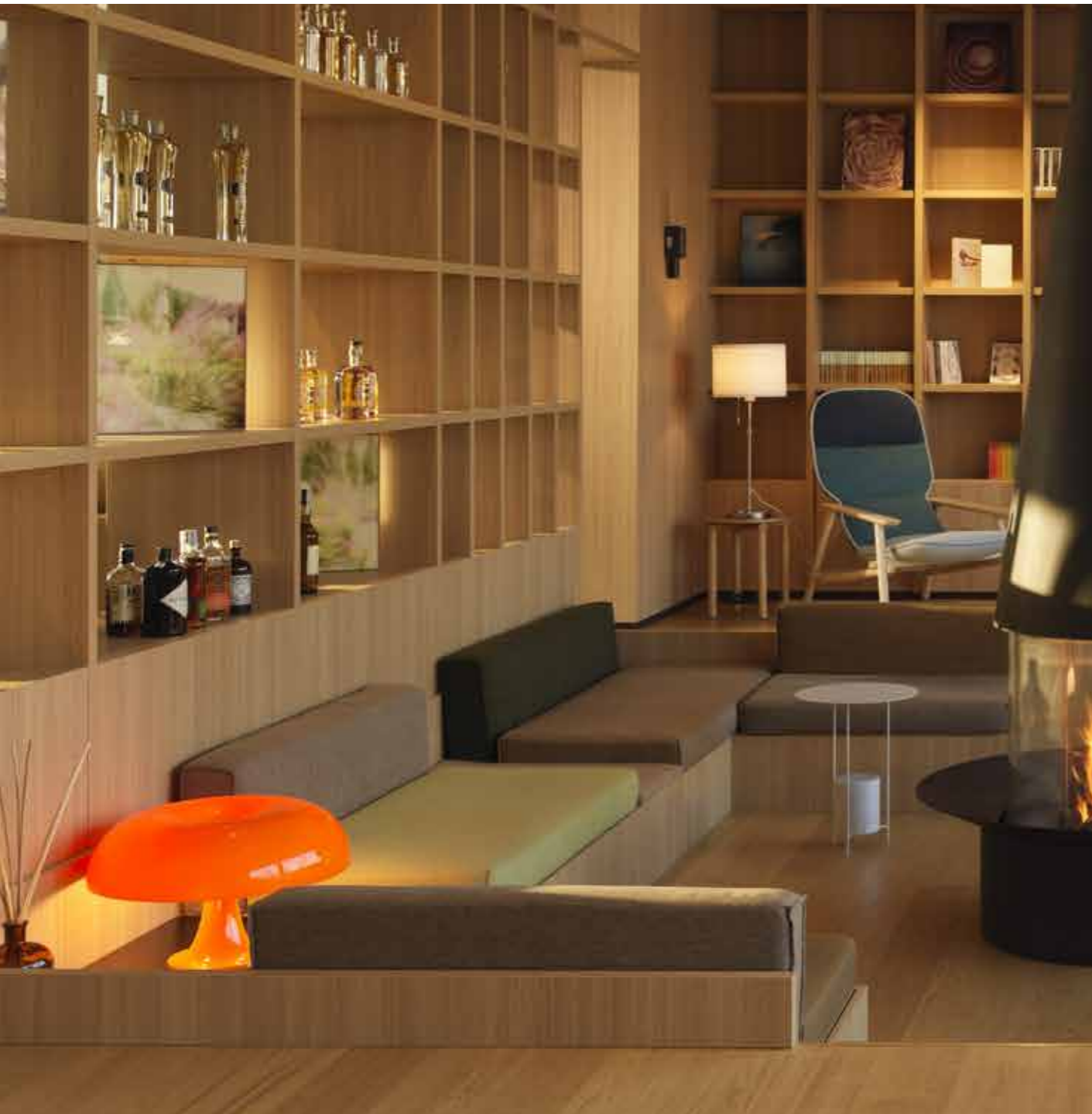
Le Fucine Hotel / Main Lounge